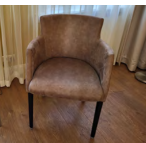
Een van de prachtige nieuwe stoelen dankzij de Lions

De afgelopen anderhalf jaar hebben de Lions Wassenaar de Pauw ons hospice als hun goede doel bestempeld. Dat leverde al diverse prachtige giften op zoals nieuwe dekbedden, een nieuw hoog-laag bed, nieuwe glijzeilen en kalenderblokken waarover wij in eerdere nieuwsbrieven al berichtten. Onlangs werden daar zes hele mooie nieuwe stoelen voor de gastenkamers aan toegevoegd. Half mei ontvingen we als prachtig sluitstuk een cheque t.w.v € 4.000. Dit was de opbrengst van een 'Kaart Kroegen Tocht' die de Lions hadden georganiseerd. We sparen voor een nieuwe passieve til-lift zodat onze gasten getild en verplaatst kunnen worden als zij niet meer zelfstandig kunnen helpen bij het uit bed komen. Onze huidige til-lift vertoont af en toe mankementen, en het is helaas niet meer mogelijk om nieuwe onderdelen te bestellen. De cheque van de Lions wordt aan onze spaarpot toegevoegd. Dank zij de acties van de Lions hebben wij allemaal noodzakelijke vervangingen kunnen doen waardoor onze gasten in een fijne, huiselijke omgeving comfortabel kunnen verblijven. Hospice Wassenaar dankt de Lions Wassenaar de Pauw voor deze hartverwarmende ondersteuning.