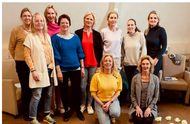
Nieuwe vrijwilligers krijgen een gedegen training

In juni vindt een basisvaardigheidstraining plaats waar praktische vaardigheden worden aangeleerd en toegelicht. Hierbij komen ook veiligheid en hygiëne aan bod. Over een half jaar komen de 10 nieuwe vrijwilligers bijeen voor een terugkomochtend om hun eerste ervaringen als zorgvrijwilliger te bespreken.