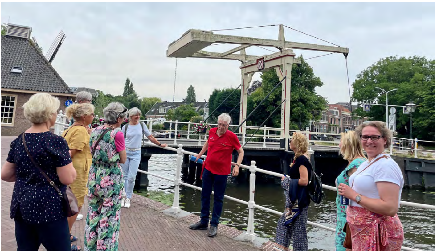
Stads- en hofjeswandeling in Leiden

Veel dank gaat uit naar de grote groep vrijwilligers die zich belangeloos inzet voor ons hospice. Het was enorm fijn dat we hen samen met het verpleegkundig team in juli konden uitnodigen voor een Stads- en hofjeswandeling in Leiden met aansluitend een Italiaans diner. In december sloten we het jaar af met een gezellig samenzijn in Brasserie Buitenhuis waarbij alle vrijwilligers en verpleegkundigen een kerstattentie ontvingen.