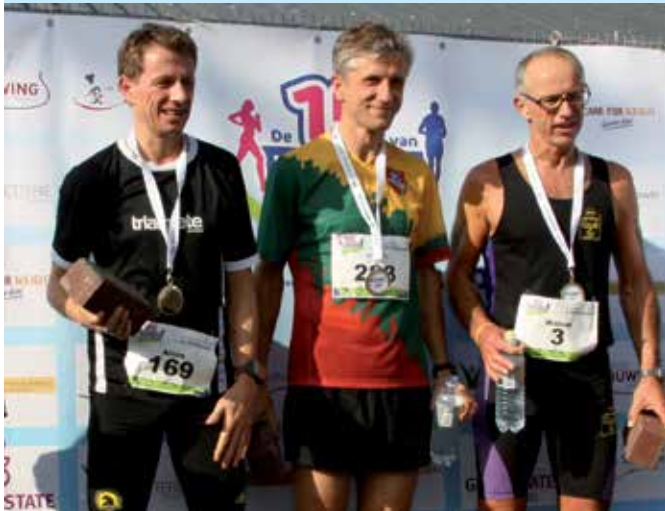
De nummers 1, 2 en 3 van de eerste editie van "de 15 van Wassenaar."

Voor de herinrichting van het nieuwe gebouw tot hospice zijn wel extra financiën nodig. De Lions club Wassenaar organiseert jaarlijks een winterfeest; deze keer Lions Winter Olympic party op 18 januari 2014 met als goed doel Hospice Wassenaar.