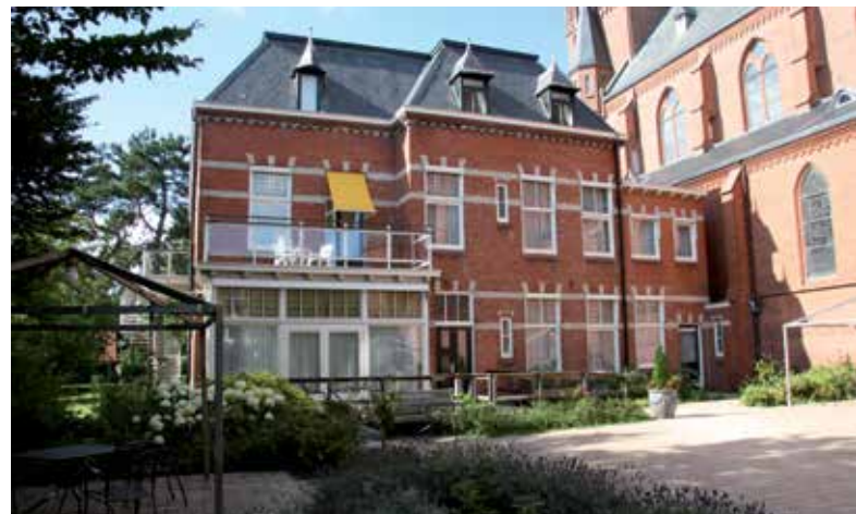
De achterzijde van het nieuwe hospice, de wens is om hier een prachtige tuin voor onze gasten en familie te creëren.