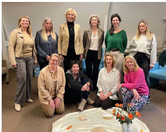
Nieuwe vrijwilligers leren tijdens introductietraining oa 'hoe je er kunt zijn'

De nieuwe vrijwilligers volgden ook de basisvaardigheden-training. Hierin wordt aandacht besteed aan ondersteunende handelingen bij de zorg voor de gast. Deze training werd verzorgd door een ervaren vrijwilliger en een verpleegkundige. In november werd er voor de groep startende vrijwilligers een evaluatiemoment georganiseerd waarbij teruggekeken werd op de training en de inmiddels verworven ervaring. Tijdens deze bijeenkomst werd er ook aandacht besteed aan intervisie.