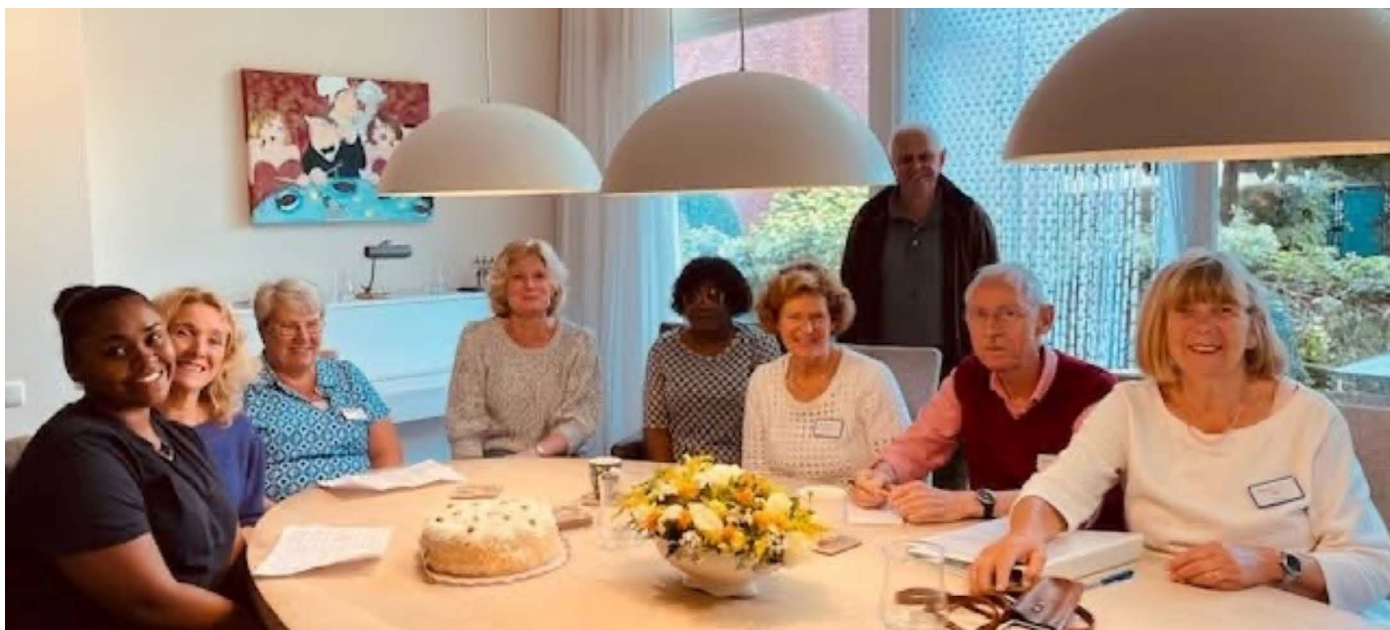
Coördinatoren, verpleegkundigen en vrijwilligers tijdens de overdracht

Veel dank is het hospice verschuldigd aan de Wassenaarse huisartsen die de medische zorg voor de gasten overnemen, als de eigen huisarts vanwege de afstand naar Hospice Wassenaar die zorg niet kan verlenen.